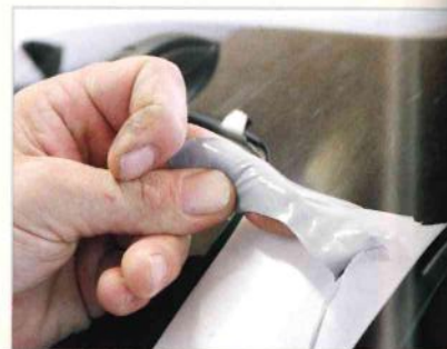
Oben: Die AutoSprühFolie lässt sich leicht und rückstandslos wieder vom Untergrund entfernen

Was versteht man nun aber unter der AutoSprühFolie, die aus Flüssiggummi besteht? Das Flüssiggummi ist eine multifunktionale, wiederablösbare Gummibeschichtung, die durch Aufsprühen leicht und schnell aufgetragen werden kann und nach der Trocknung alle Vorteile einer Gummi-