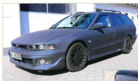
Mitsubishi Galant in mattem blau-safir-Effekt - sobald das Fahrzeug nass wird - zeigt sich ein glänzend-blauer-Effekt

Von mibenco® gibt es neben Sprays auch eine Pflegeserie mit Vorreiniger, Shampoo, Versiegelung und Zubehör, sowie komplette Pflege- und AutoSprühFolie-Sets zu kaufen. Diese können im Internet oder direkt bei Engel Design bestellt werden.