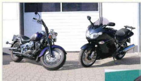
Die AutoSprühFolie kann auch bei Zweirädern gut eingesetzt werden - oder bei Motorradhelmen als Schutzschicht