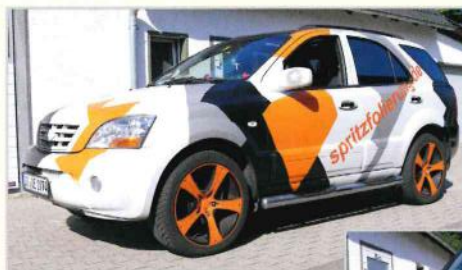
Kia Sorento in matt-weiß mit Camouflage „Make up“