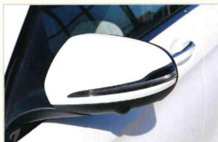
Exklusiver Auftritt des Mercedes-Benz GLE Coupés mit matt-weißen Spiegeln und Radläufen

Das Flüssiggummi hält sogar extremen Temperaturen stand. Egal ob minus 40 Grad oder plus 120 Grad. Noch dazu ist das Flüssig-