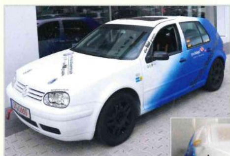
Auszubildende der Thiel-Gruppe hatten in monatelanger Arbeit einen VW Golf IV GTI für einen Rallyeeinsatz aufgebaut. Für das Finsih sorgte Engel-Design mit einem Verlauf von matt-weiss-met. in matt-blau-met. und Felgen in matt-schwarz