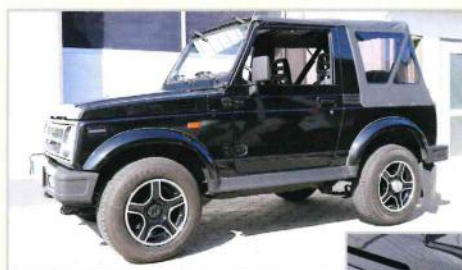
Suzuki Samurai in glänzend schwarz - durch die Versiegelung wurde das Gutachten des Oldtimers erhöht