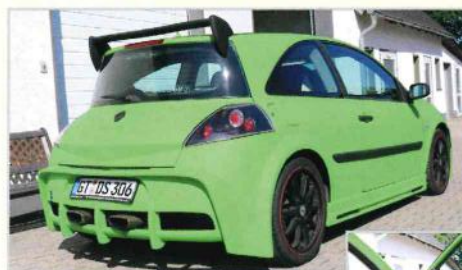
Renault Mégane in matt-grün - das Fahrzeug wurde auch im Innenraum farblich angepasst